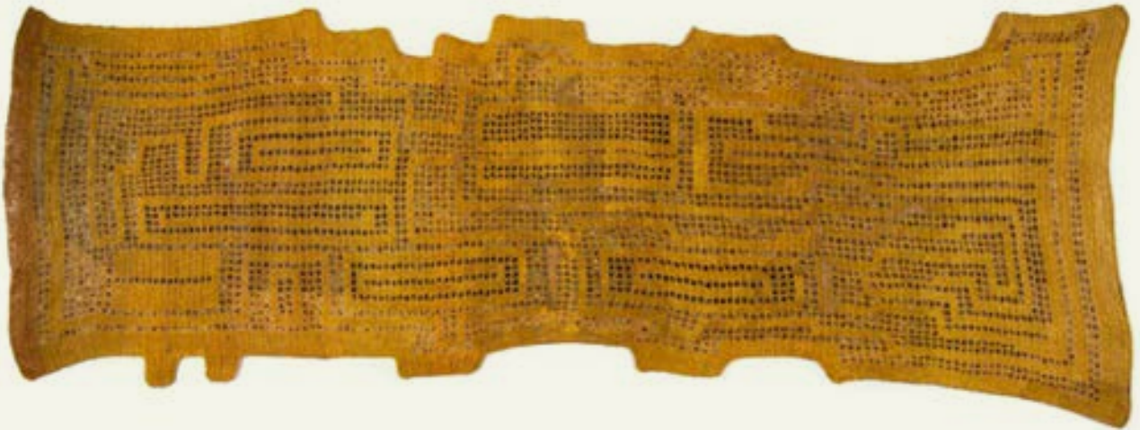
LIMITE , de la serie Inevitable (2021 a 2025) Tejido al crochet con hilos de algodón pigmentados, pintura, hilos revestidos en resina acrílica 90 cm x 240 cm