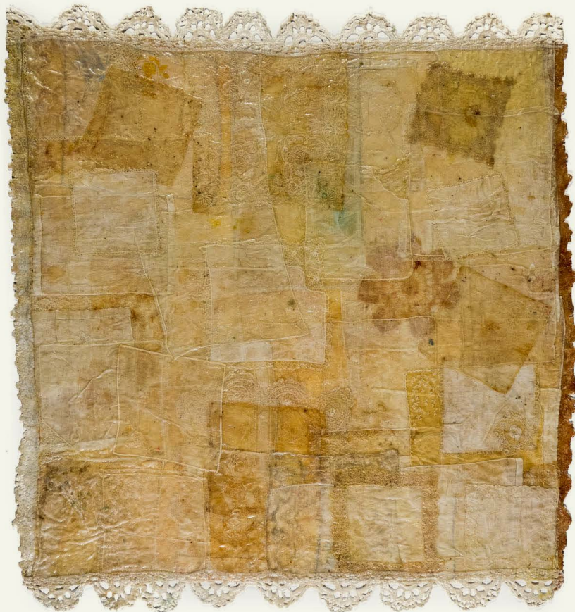
DOLOR , de la serie Inevitable (2021 a 2025) Pañuelos antiguos sin teñir cocidos a rejillas de cocina revestidos en resina acrílica. 122 cm x 100 cm